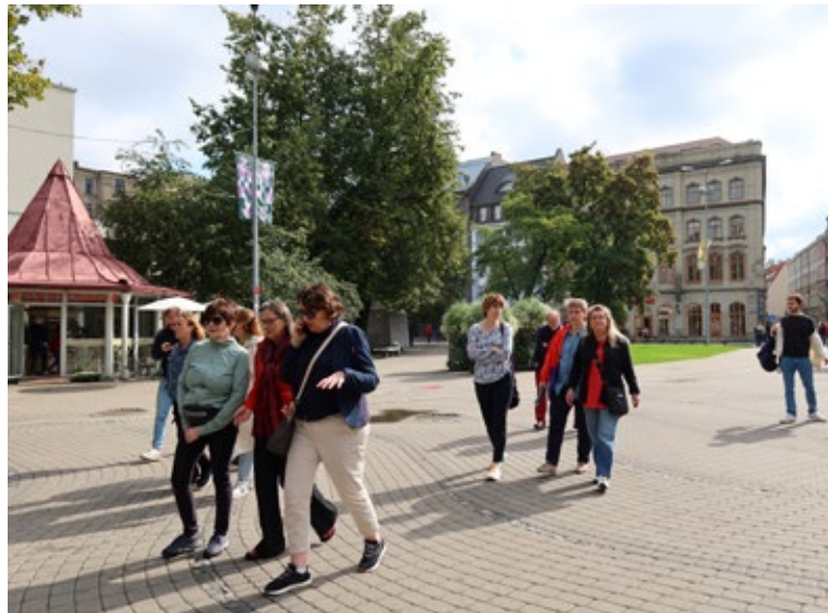
Borgin er einstaklega falleg og við getum mælt með að heimsækja hana.