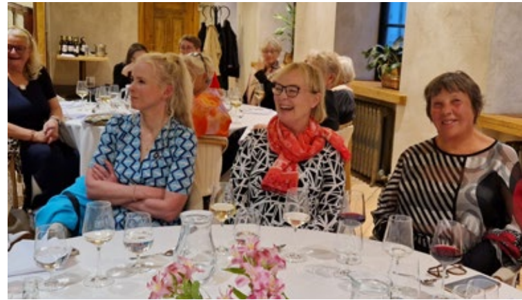
Allir skemmtu sér konunglega.