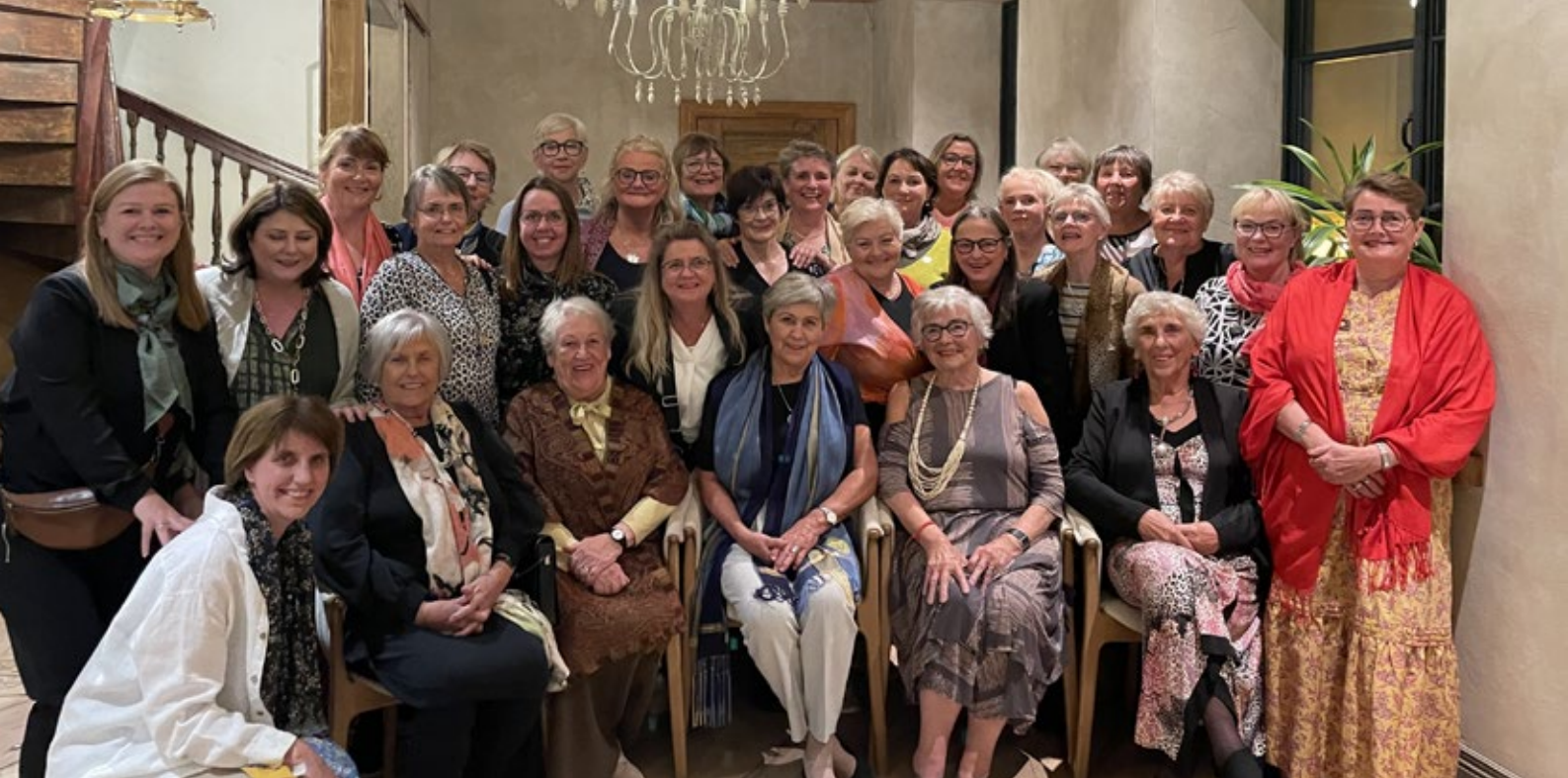
Hópurinn sem fór til Riga átti ánægjulega daga í borginni.