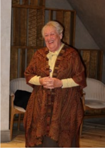
Lovísa sagði sögur eins og henni einni er lagið og var mikið hlegið.