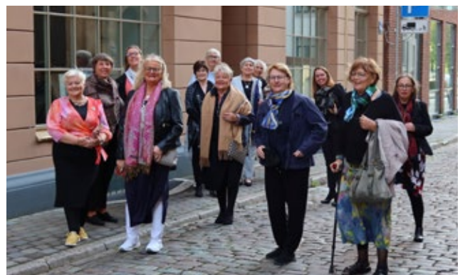
Á göngu um borgina.