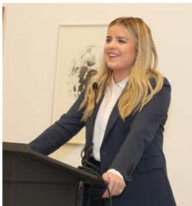
Áslaug Arna Sigurbjörnsdóttir dómsmálaráðherra talaði af innilegri sannfæringu um þá breiðu samstöðu sem náðst hefur á vettvangi stjórnmálanna í baráttunni gegn kynbundnu ofbeldi.

Í aðalsal Listasafnsins voru stólaraðir, um 80 sæti í allt, og var sest í þau öll. Í hverju sæti var kort með merki SIGURHÆÐA og númeri á röð og sæti. Voru gestir beðnir um að kvitta á kortið með nafni, kennitölu og símanúmeri. Ef til smitakningar kæmi skyldi ekkert upp á SIGURHÆÐINGA að klaga. Núna hafði