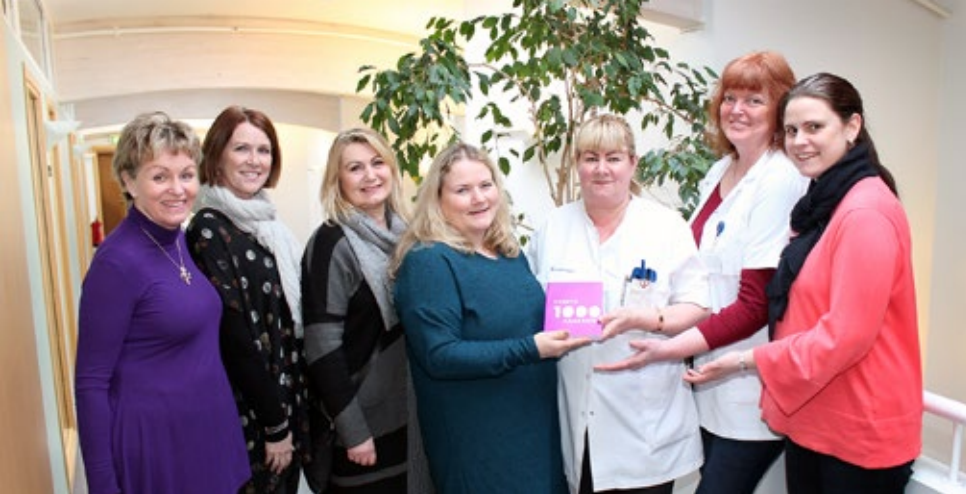
Afhending bókaþjafar í heilsugæslu Mosfellsbæjar