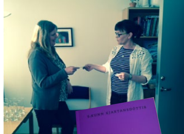
Afhending styrks til þróunar á hópmeðferð frá Soroptimistaklúbbi Reykjavíkur.