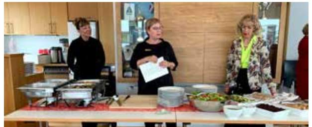
Systur nutu hátíðarkvöldverðar, tóku lagið, sögðu skriftur og höfðu gaman saman.