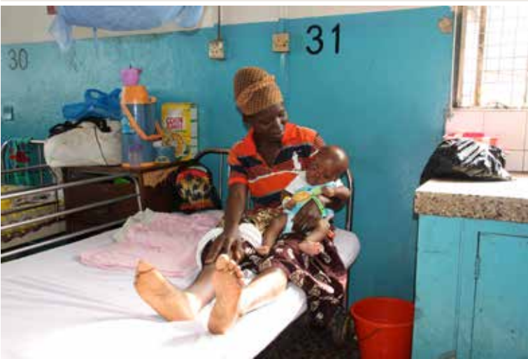
Móðir með barn sitt. Flest börn koma of seint og eru orðin mjög veik. Barnadauði er mikill, eða 27,8% (0-5 ára) borið saman við Ísland sem er 3 % (Árið 1850 var þessi tala 25-30% á Íslandi)