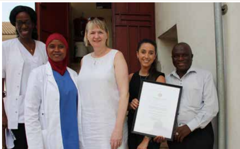
Styrkurinn afhentur. Um 300 börn koma á neyðarmóttökuna daglega. 1-3 börn deyja daglega á spítalanum. Læknisþjónusta fyrir börn að 5 ára aldri er ókeypis.